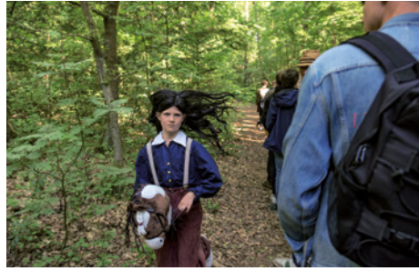
Tijd van de Wolf, The Cure , Oerol Festival, 2023.

het leven niet meer gaat? Samen met scenograaf Sacha Zwiers en componist Roald van Oosten creëert ze voorstellingen onder de naam Tijd van de Wolf waarbij er ruimte en aandacht is voor het niet weten, de ontregeling en verwondering. Hun nieuwsbrief over de nieuwe voorstelling The Cure valt meteen op: 'We are all human. But there is a cure'. Tijdens deze theaterervaring op Oerol (juni 2023) onderging het publiek als het ware een transformatie van mens tot boom. Het overgangsrитуeel, gemaakt met basisschoolkinderen van Terschelling, is een levendige manier om sociale interactie met emotionele participatie mogelijk te maken. In de huidige tijd met onze oplossingsgerichte oriëntatie op psychische problemen en economische visie op het menselijk bestaan is volgens Broeder weinig plek voor existentiële vragen.