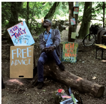
Rainbow Soulclub 'We zijn één grote familie'

Onder: Rainbow Soulclub, Free Advice met Totty Telgt, kunstmanifestatie Cure Park, juli 2017 Rechtsonder: Rainbow Soulclub, Rearrangement of Priorities #9 (HOME) , 2021. Tentoonstelling in ROZENSTRAAT - a rose is a rose is a rose