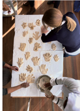
Links: Bakkerij de Eenvoud in samenwerking met Gran Collectivo Pantitlan, Baking an Offering , 1-2 november 2020 Midden: Bakkerij de Eenvoud in samenwerking met Tina Lenz, Baking Body Stories , 8 maart 2022