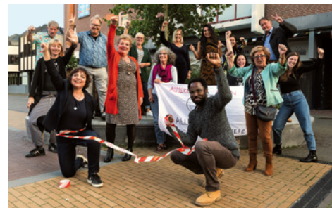
SPACE, Rehearsing the Revolution , 27 oktober- 1 november 2020, Corrosia Theater, Almere.

met twaalf deelnemers gaven we intuïtief vorm aan een fictieve wereld en speelden vanuit een systemische opstelling diverse rollen (onder andere de zee, berg, bijen, kinderen van de toekomst). Dilemma's als vervuiling, armoede, etnische spanningen en criminaliteit werden in kaart gebracht om vervolgens een verandering (revolutie) in gang te zetten.